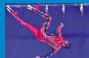
Super Silva Spiderman homme araignée