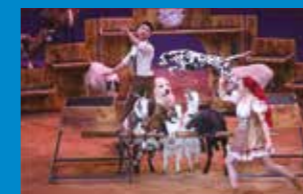
Namayca Bauer Les animaux de la ferme