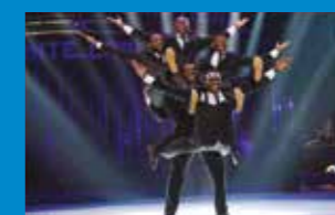
Black blues brothers Acrobates