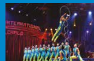
Troupe acrobatique de Dhezou - Sauteurs