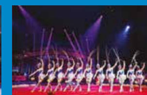
Troupe acrobatique de Dhezou - Diabolos