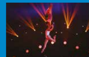
Deep Red Numéro aérien